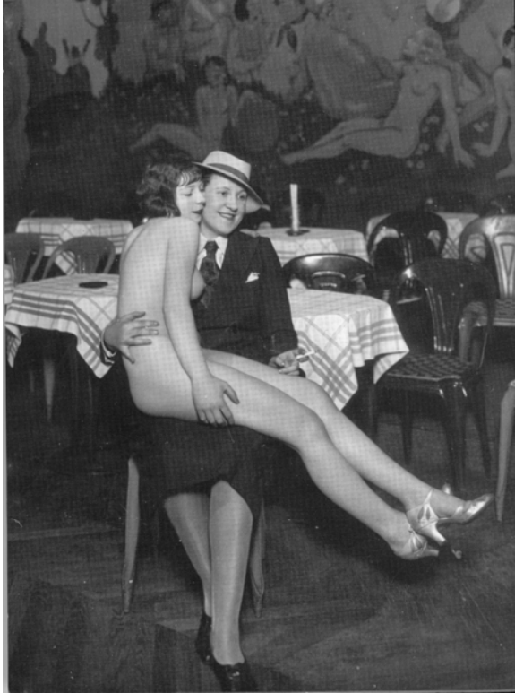
Le Boudoir au National